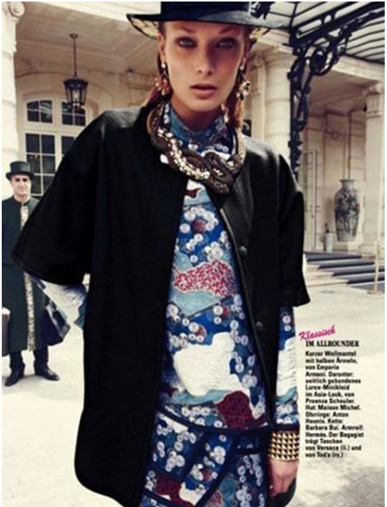
Klassisch IM ALLROUNDER Kurzer Wollmantel mit halben Ärmeln, von Emporio Armani. Darunter: seitlich gebundenes Lanex-Mini Kleid im Asia-Look, von Proenza Schouler. Hut: Maison Michel. Ohrringe: Anton Heunis. Kette: Barbara Bul. Armband: Hermès. Der Baggie trägt Taschen von Versace (li.) und von Tod's (rs.)