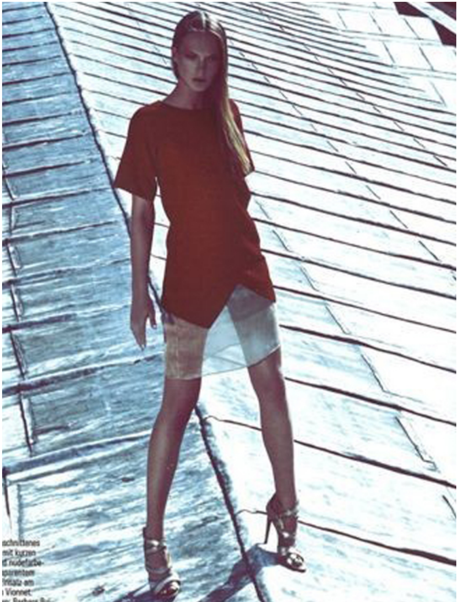
asymmetrisches mit kurzen dunkelroter spitzen frisch am Vionnet von Barbara B.