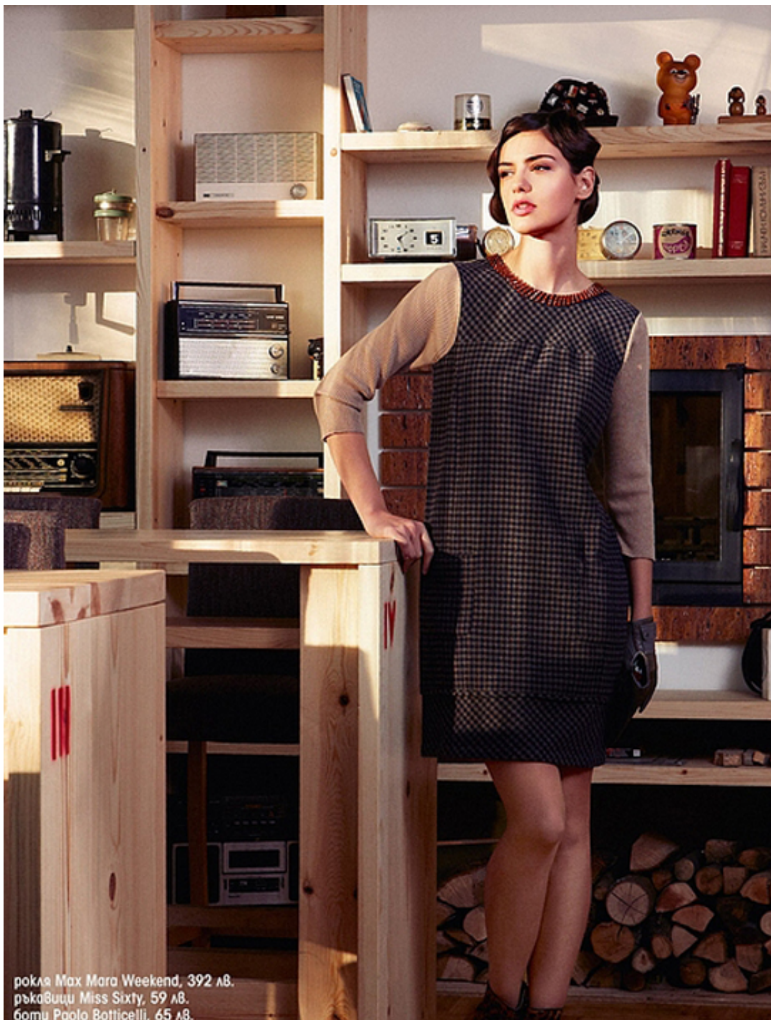
рокля Max Mara Weekend, 392 лв. ръкавици Miss Sixty, 59 лв. боти Paolo Botticelli, 65 лв.