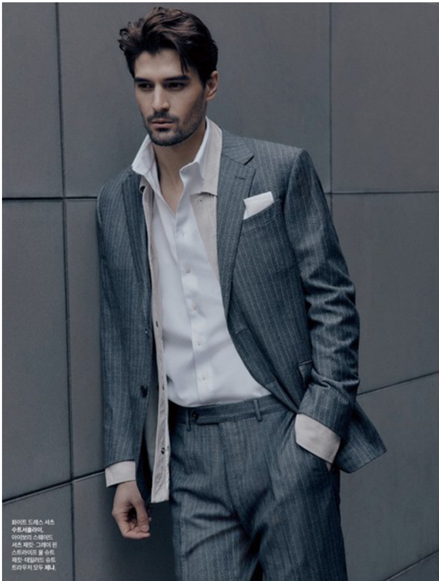
화이트 드레스 셔츠 수트셔플라이, 아이보리 스텝어드 셔츠 재킷 그레이 편 스트라이프 울 슈트 재킷 테일러드 슈트 트라우저 모두 제나.