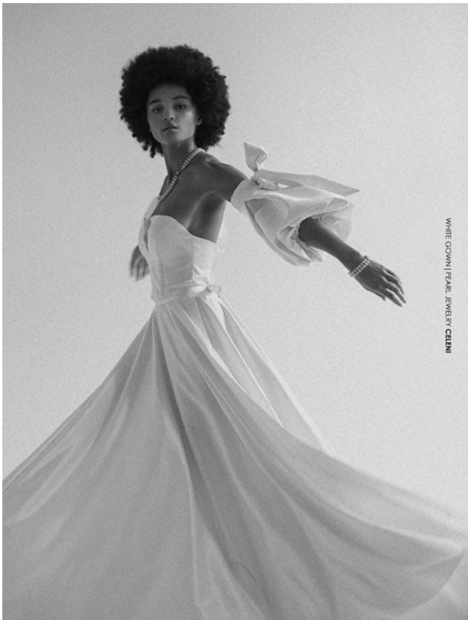
WHITE GOWN | PEARL JEWELRY CELENI