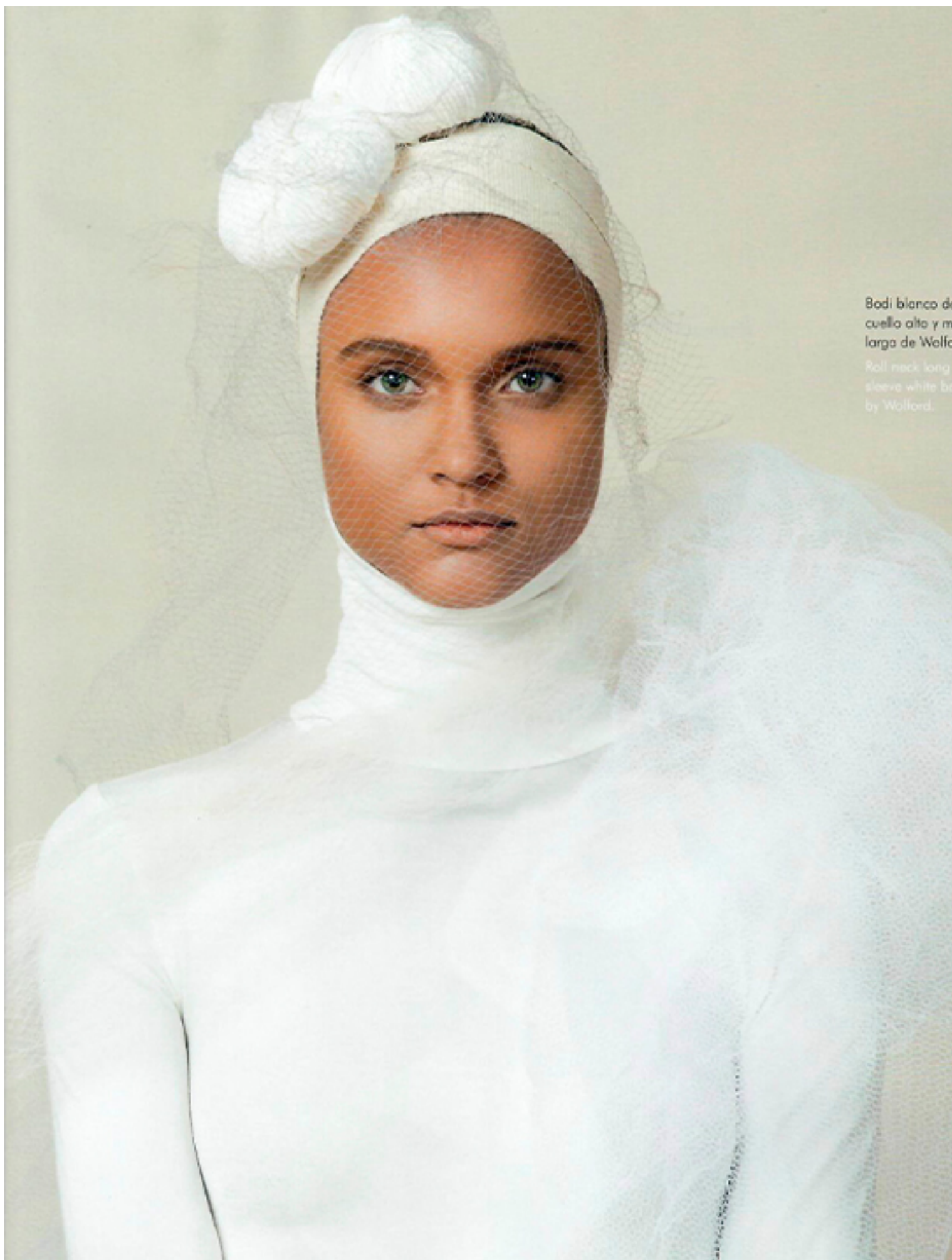
Bodi blanco de cuello alto y m largo de Welfo Roll neck long sleeve white bo by Welford.