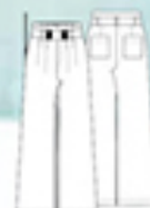
CALÇA 110 *** tam. 40