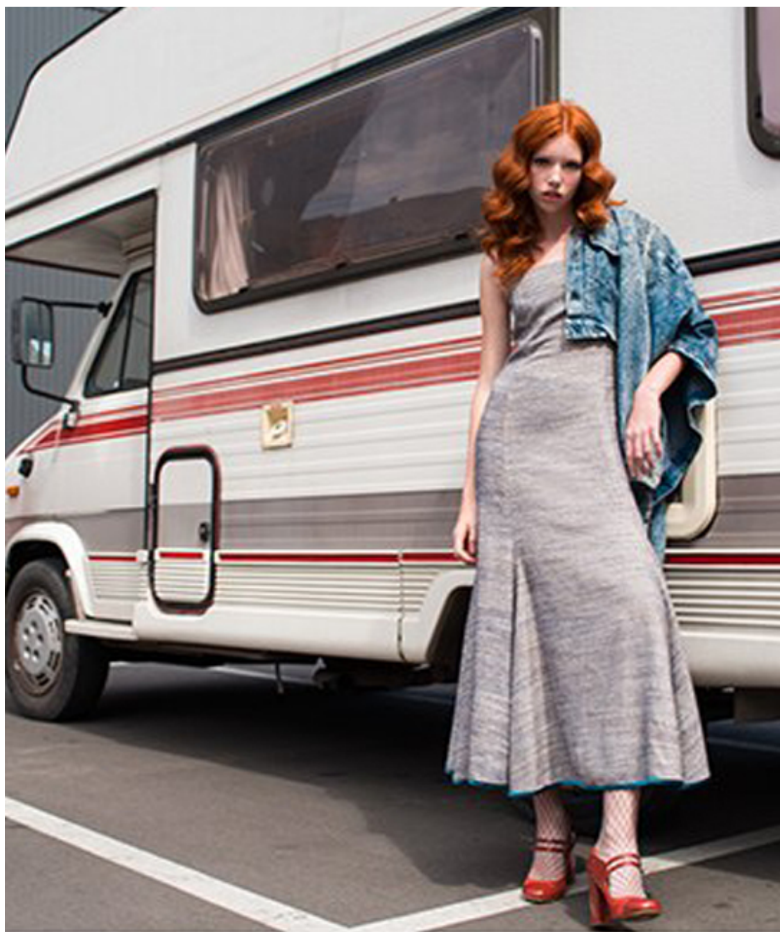
Jika. Jacket by Roja. Shoes by H! by Henry Holland. Tights by Wolford