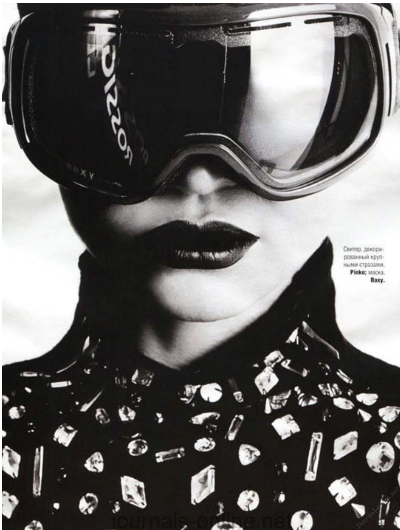
Свитер, декори- рованный круп- ными стразами, Pinko ; маска, Roxy .