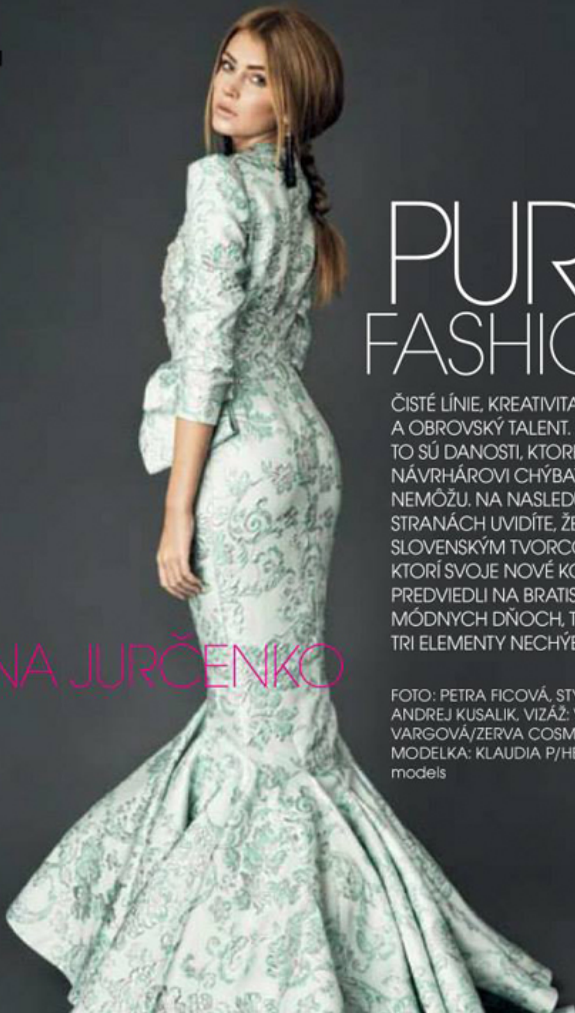
STYLING: ANDREJ KUSALIK, VIZÁŽ: VERONIKA VARGOVÁ/ZERVA COSMETICS, MODELKA: KLAUDIA P/HERIETT models