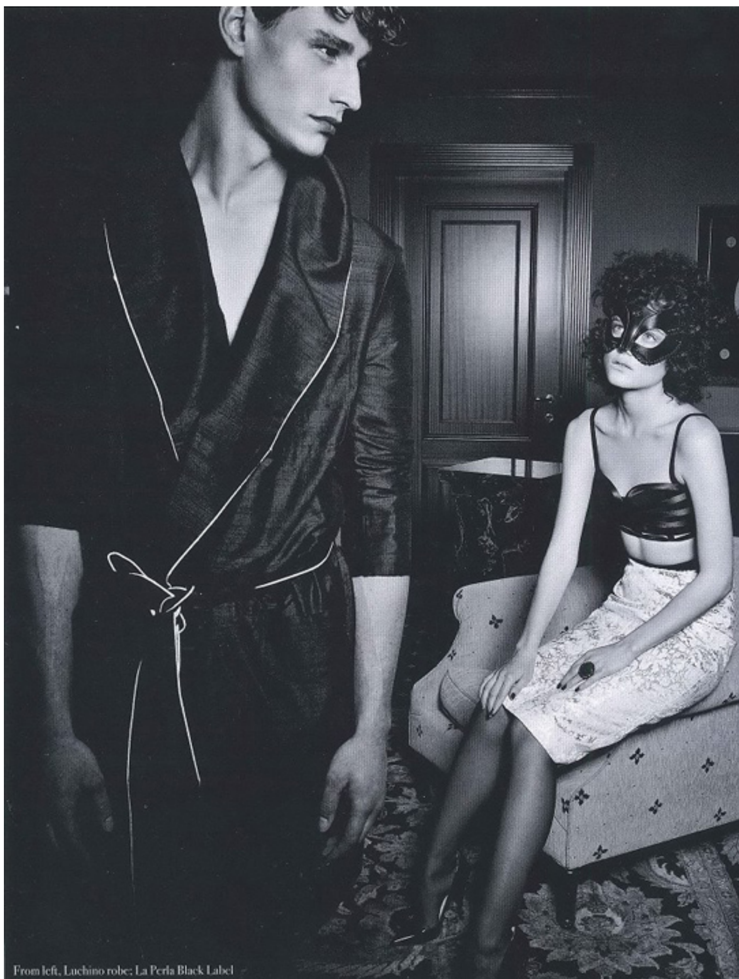
From left, Luchino robe; La Perla Black Label